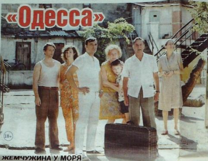
ЖЕМЧУЖИНА У МОРА