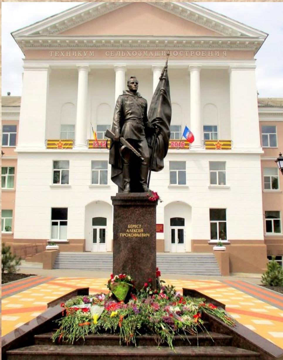
Сельмаш, Первомайский район, Ростов-на-Дону.