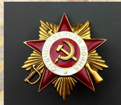
Орден Отечественной войны I степени