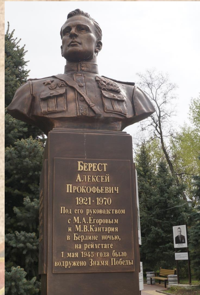
Бюст А. Бересту на территории завода Ростсельмаш