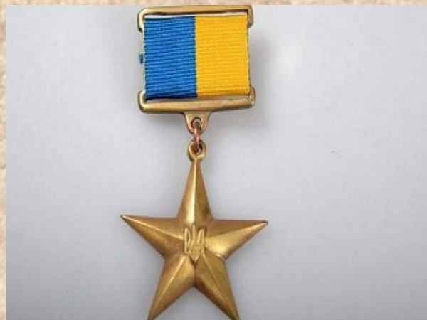
Звание Герой Украины с удостоиванием ордена «Золотая Звезда»