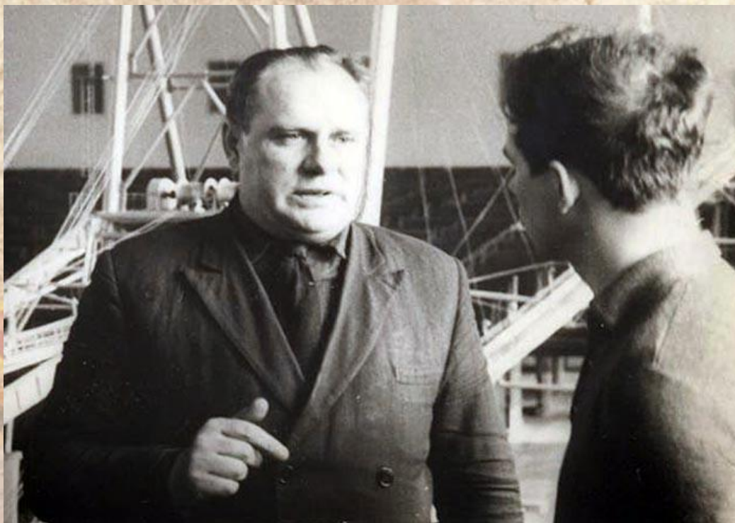
Последнее место его работы - шофёр на Ростовской кондитерской фабрике.