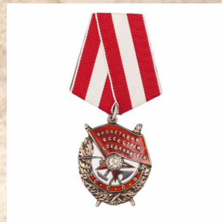
Орден Красного Знамени